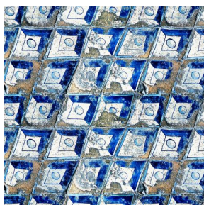
CLEMENTINA Azur 137