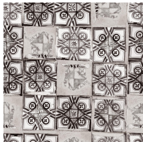
PAOLO Ficelle 09 Motif d'impression