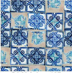
PAOLO Azur 137