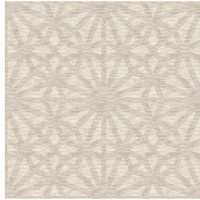
6035 Beige 63 Motif d'impression