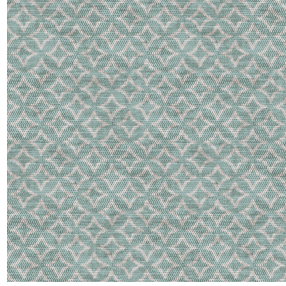
6036 Minéral 157 Motif d'impression