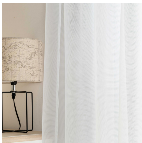
834S BLANC 01 Support d'impression