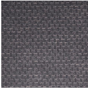
RUSTIC Titanium 98