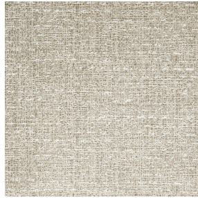
RUSTIC Naturel 26 Motif d'impression