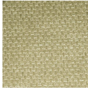
RUSTIC Bergamote 121