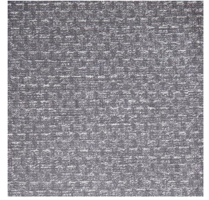
RUSTIC Taupe 95