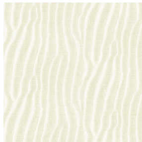
SABLE Ivoire 115 Motif d'impression