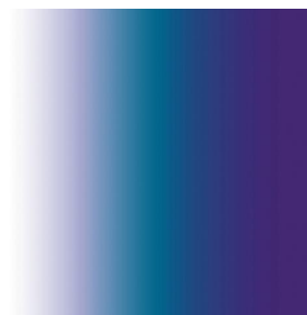
ZENITH Bleu 41