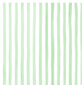
SONG Tilleul 103