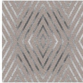
ECHO Lin 11 Motif d'impression