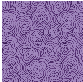
ONDES Violine 105 Motif d'impression