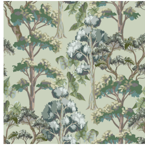
FORET Reflet 140 Motif d'impression