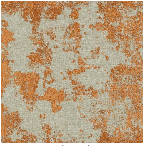
SIERRA chaudron 118