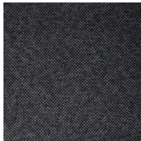
ANATOLE Titanium 98 Motif d'impression