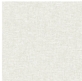
MUNA lin 11 Motif d'impression