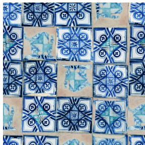
PAOLO Azur 137