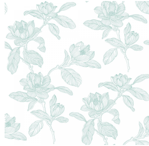
PAEONIA Turquoise 53 Motif d'impression