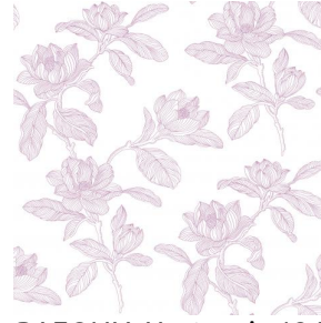
PAEONIA Hortensia 134