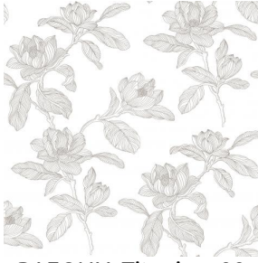
PAEONIA Titanium 98