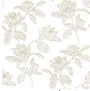
PAEONIA Beige 63