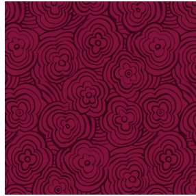
ONDES Opéra 104 Motif d'impression