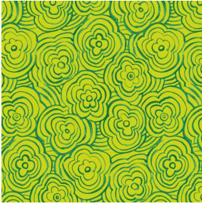
ONDES Anis 62