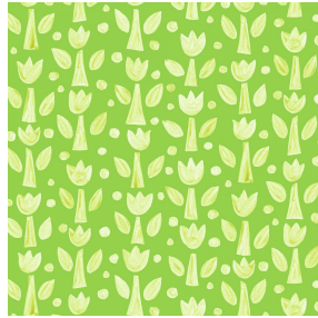
TULIPE Anis 62 Motif d'impression