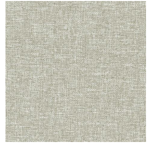
MUNA terre 107