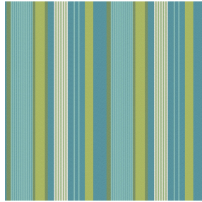
MELANIE Printemps 130 Motif d'impression