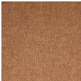
MUNA Sienna 29 Motif d'impression