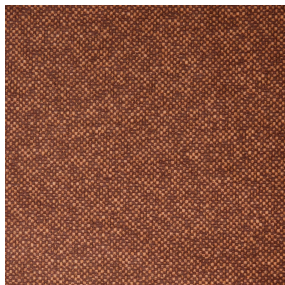
ANATOLE Chaudron 118 Motif d'impression