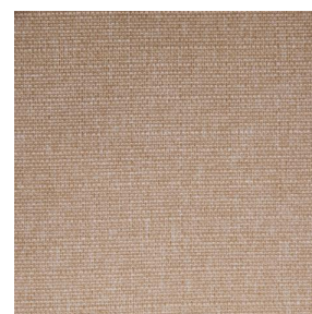
MUNA Saumon 143