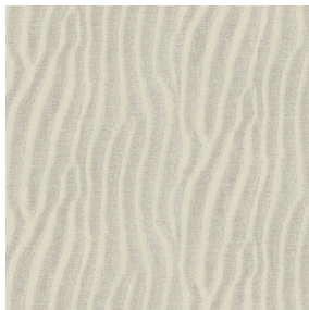
SABLE Lin 11 Motif d'impression