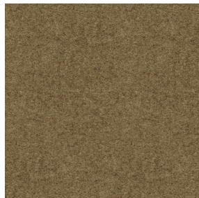
ELAINA Chamois 111 Motif d'impression