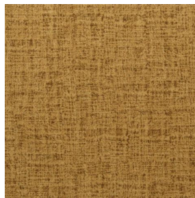
MURA SAVANE 185