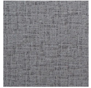
MURA MINERAL 157