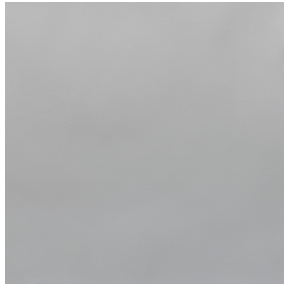
BELORA BPI 00 Support d'impression