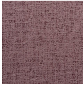
MURA ROSE 129