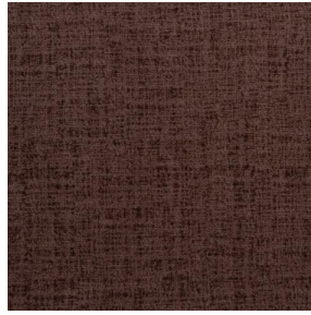
MURA TERRE 107