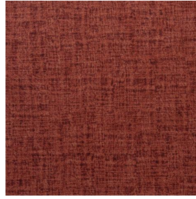
MURA GRENAT 56