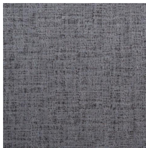
MURA ETAIN 180