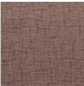
MURA DUNE 170