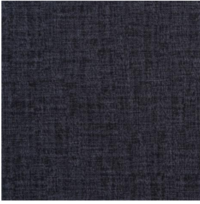
MURA NOIR 10