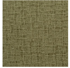
MURA OLIVE 61