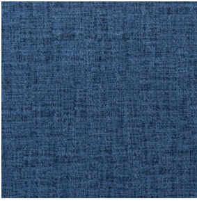
MURA SAPHIR 106