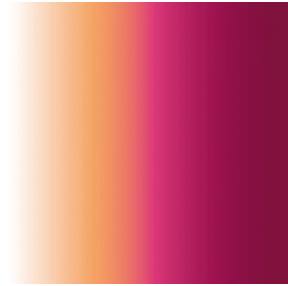
ZENITH Pivoine 57 Motif d'impression