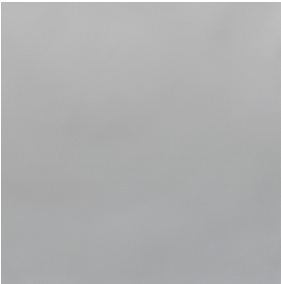
BELORA BPI 00 Support d'impression