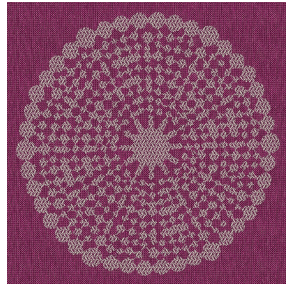
ANGELE Prune 84 Motif d'impression