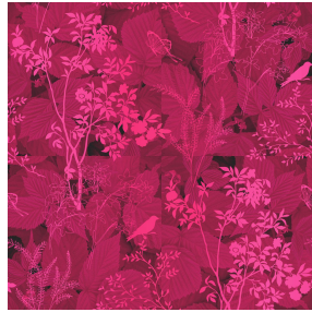
ODE Fuchsia 33 Motif d'impression