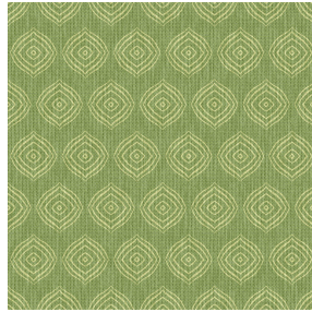
LYLA Prairie 125 Motif d'impression