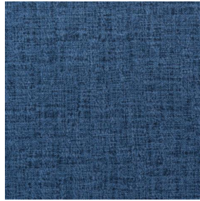
MURA SAPHIR 106