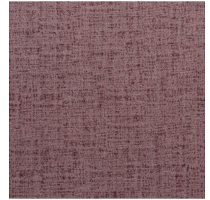
MURA ROSE 129