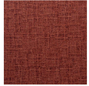
MURA GRENAT 56