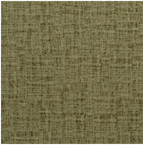
MURA OLIVE 61