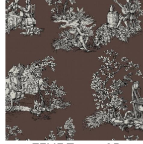
ZELIE Taupe 95