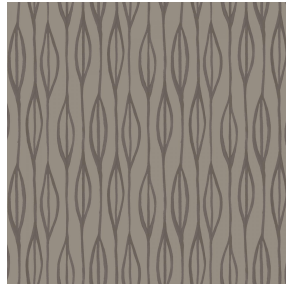
YENDI Terre 107 Motif d'impression