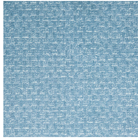
RUSTIC Glacier 43 Motif d'impression