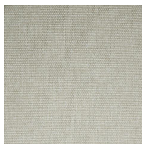
MUNA Coco 142