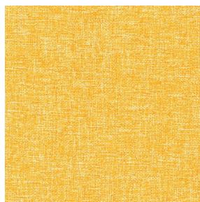
MUNA soleil 90