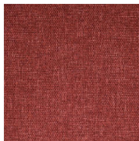
MUNA Rouge 21