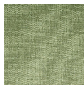
MUNA Tilleul 103