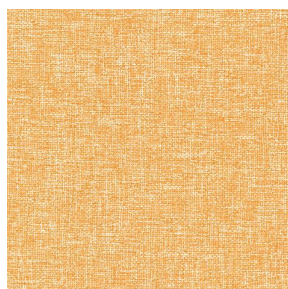
MUNA Melon 22