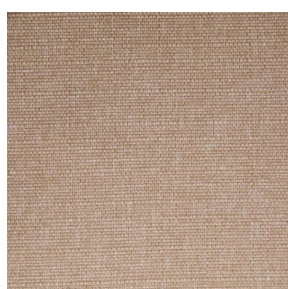
MUNA Saumon 143