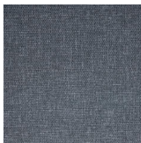
MUNA Acier 18