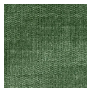
MUNA Lierre 124