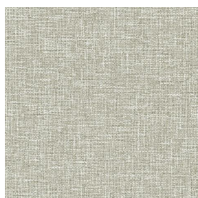
MUNA terre 107