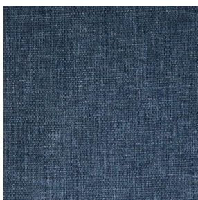
MUNA Indigo 144