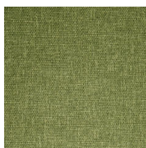
MUNA Olive 61