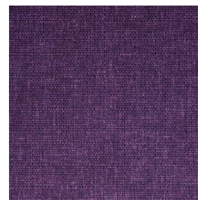
MUNA Saphir 106