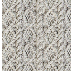
CALTRA Naturel 26 Motif d'impression