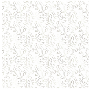
6055 Naturel 26 Motif d'impression