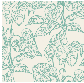
NOLAN Jade 116 Motif d'impression