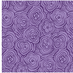
ONDES Violine 105 Motif d'impression