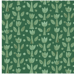
TULIPE Lierre 124 Motif d'impression