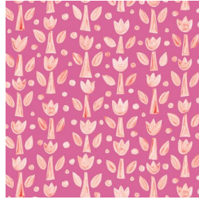
TULIPE Rose 129