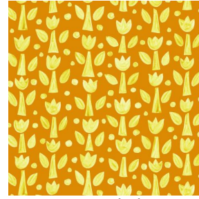
TULIPE Soleil 127