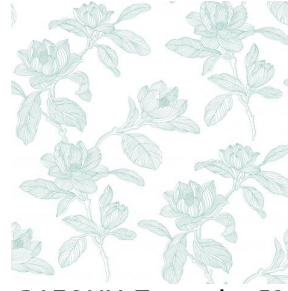
PAEONIA Turquoise 53