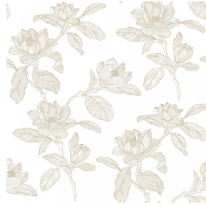
PAEONIA Beige 63 Motif d'impression