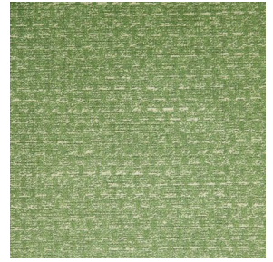
RUSTIC Mousse 92