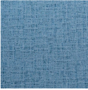
MURA GLACIER 43