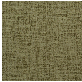
MURA OLIVE 61 Motif d'impression