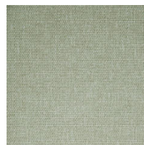
MUNA Sable 67