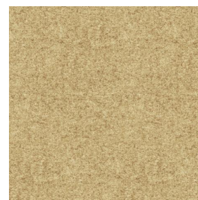
ELAINA Beige 63