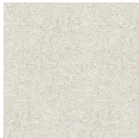
ELAINA Ivoire 115 Motif d'impression